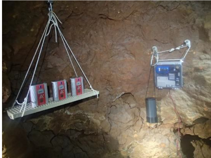
De gauche à droite AER+, Glog, et capteurs « Laplaud »